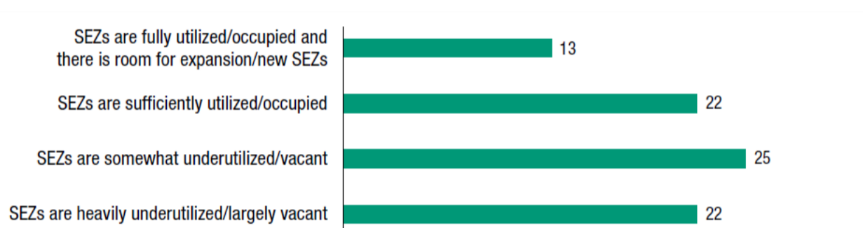
Slika 3. Stepen iskorišćenosti SEZ prema nacionalnim investicijama promotivne agencije (Procenat ispitanika u anketi)

Note: The survey was conducted from February to April 2019. Results are based on information from 114 respondents.